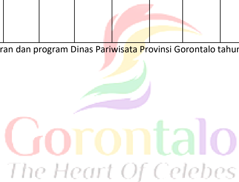
Tabel 2.8 Capaian kinerja sasaran dan program Dinas Pariwisata Provinsi Gorontalo tahun 2018-2024